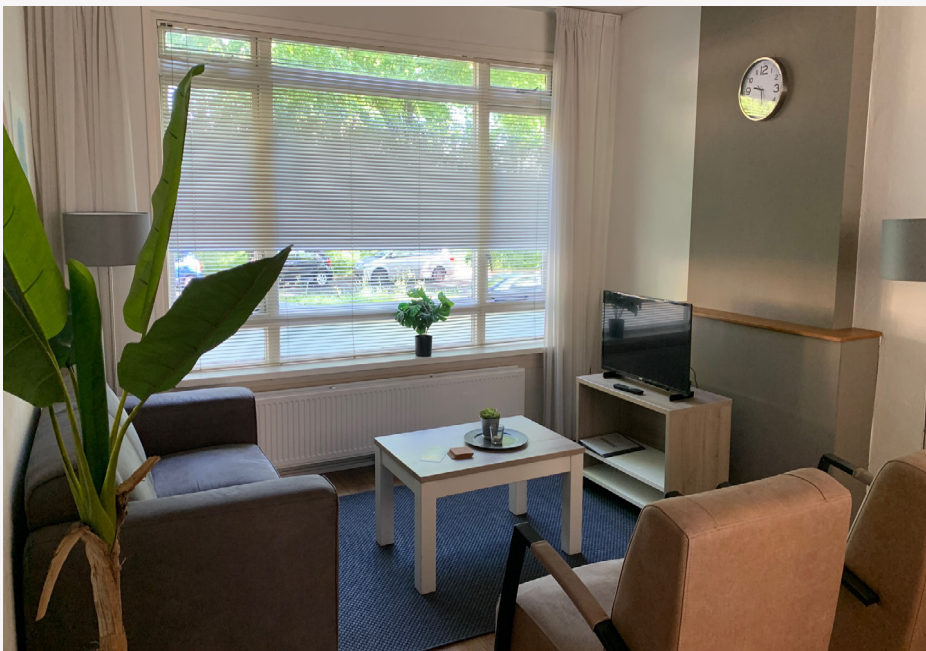
Op de foto hierboven ziet u een voorbeeld van de inrichting van een logeerwoning.

U krijgt later in het project meer informatie over de logeerwoningen en werkzaamheden.