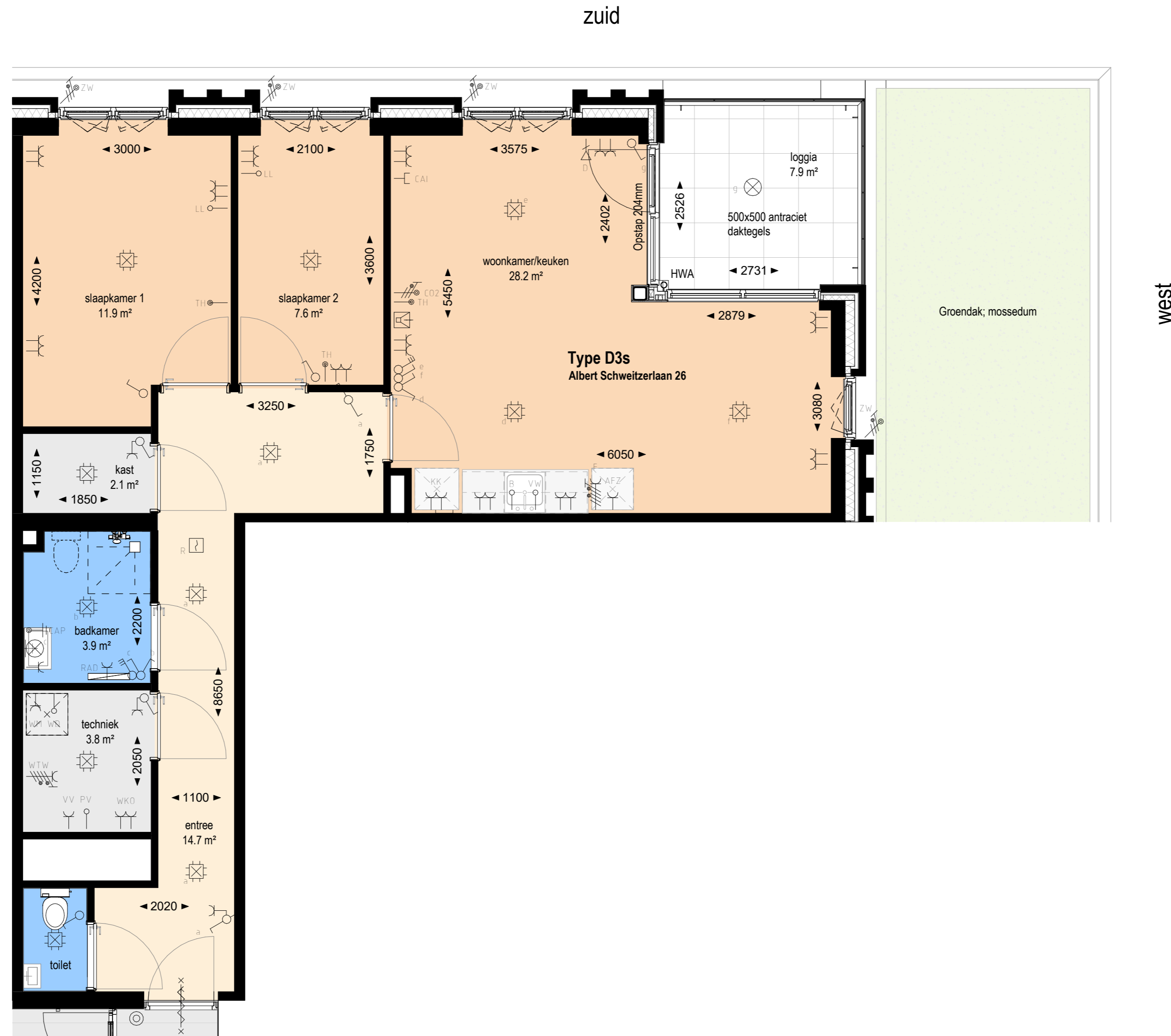
Type D3s Verdieping 1 Albert Schweitzerlaan 26