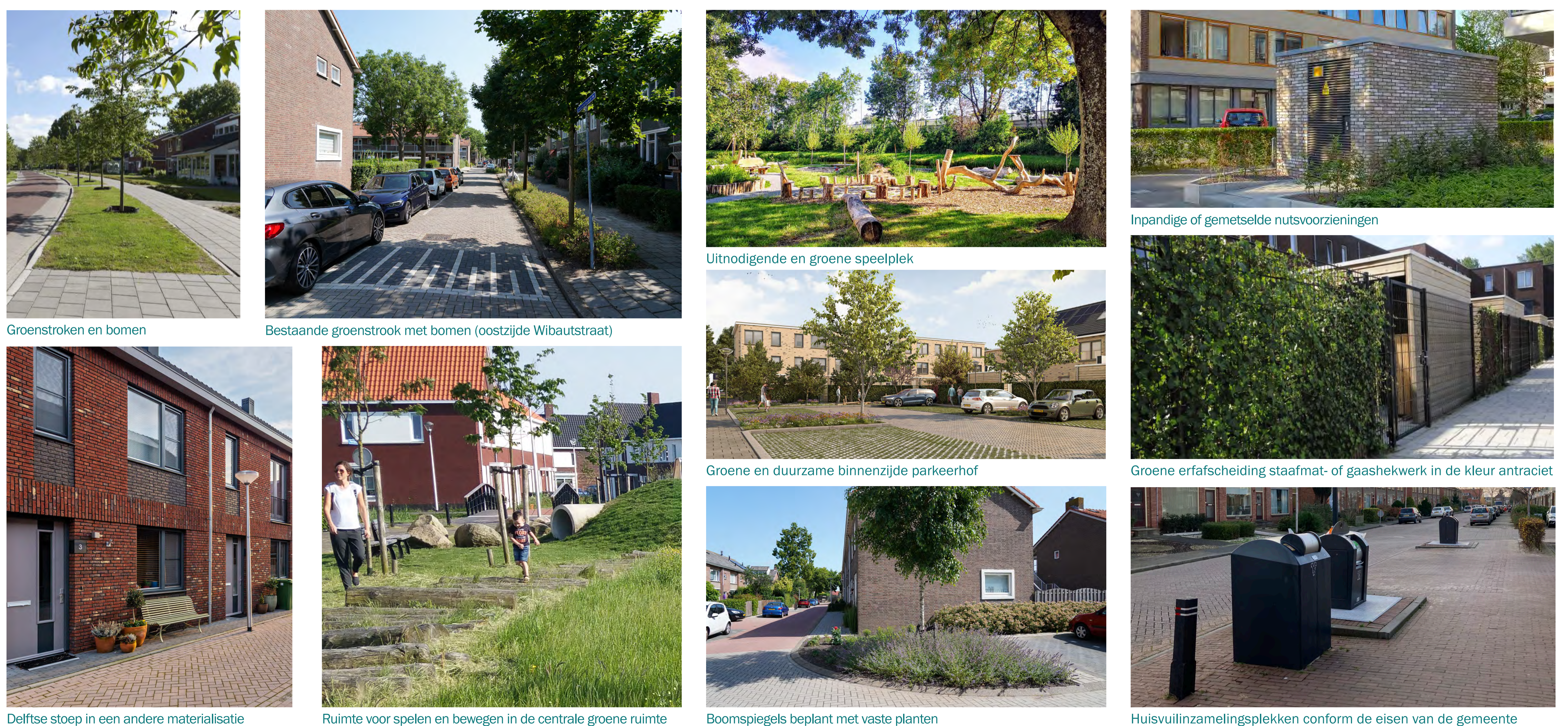
Groenstroken en bomen